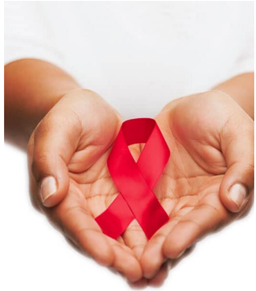
Slika 1. simbol borbe protiv AIDS-a