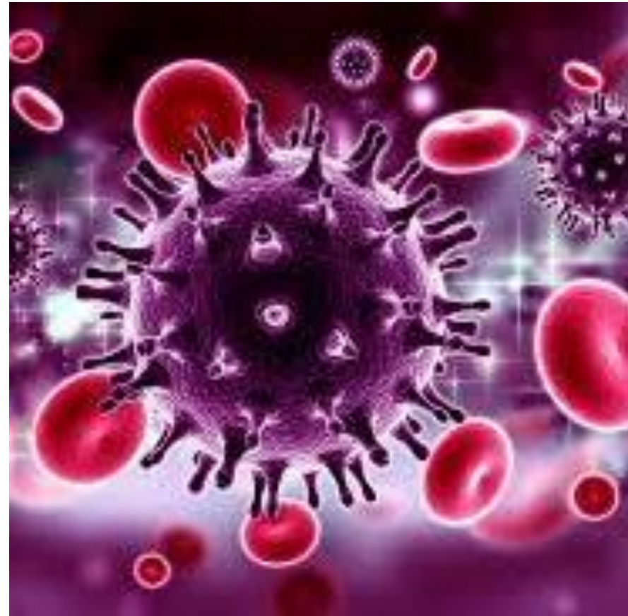
Slika 3. HIV virus