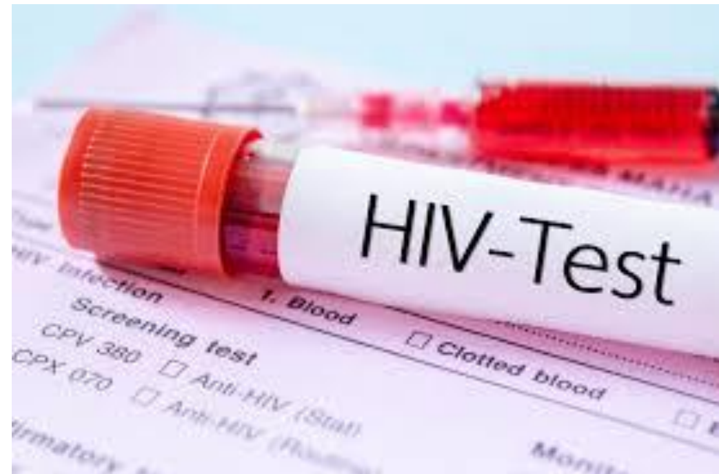
Slika 2. HIV test