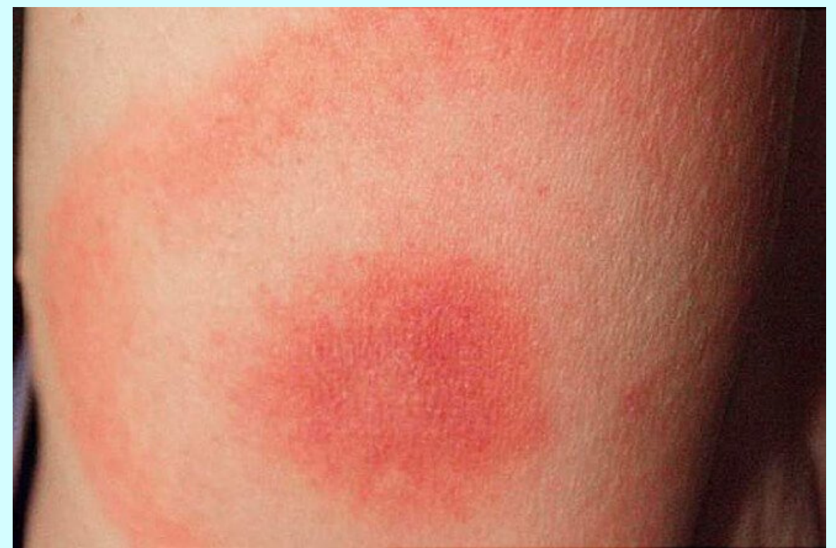
Slika 2. Kožne manifestacije