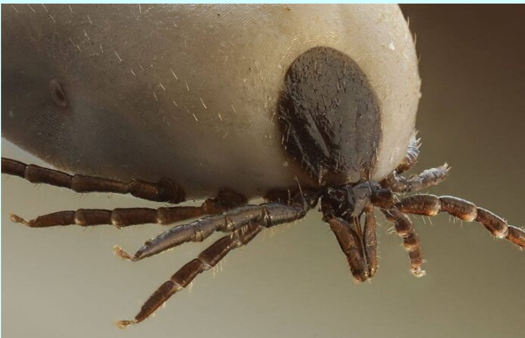
Slika 1. Krpelj - prijenosnik bolesti