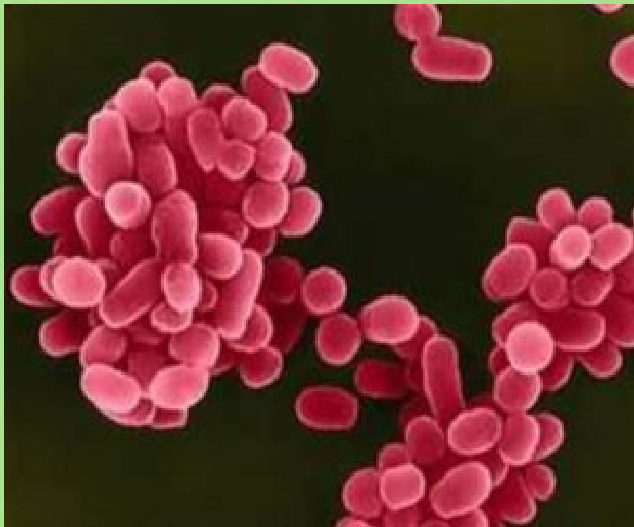
1.slika : bruceloza

-izvori infekcije: životinje s farme i sirovi mliječni proizvodi