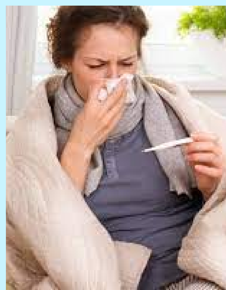
Slika 3. Simptomi gripe