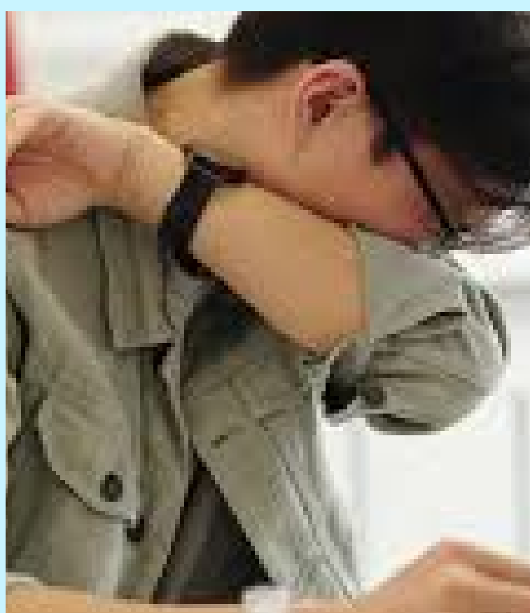
Slika 2. Prenošenje gripe