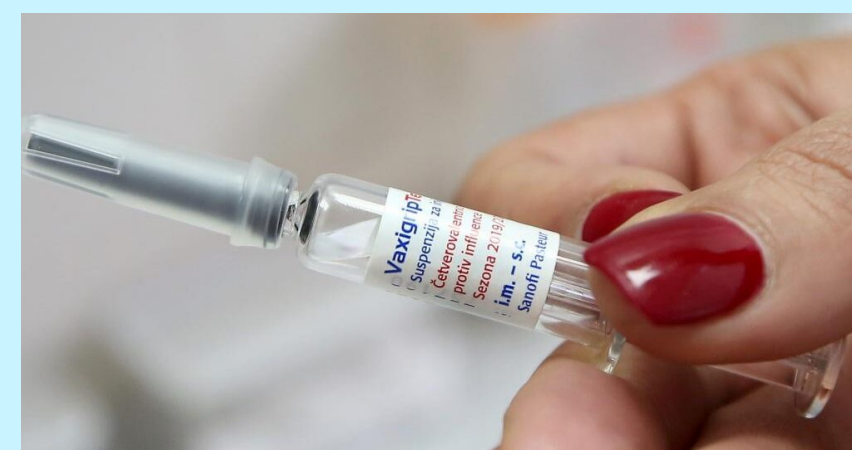
Slika 4. Cjepivo