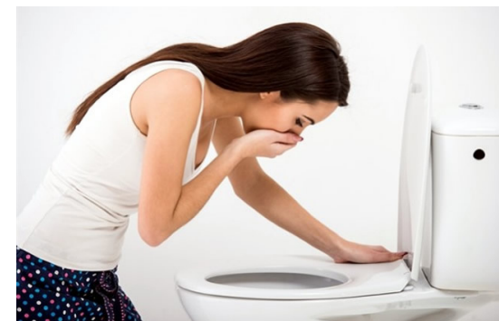
Slika 3. Simptom mučnine