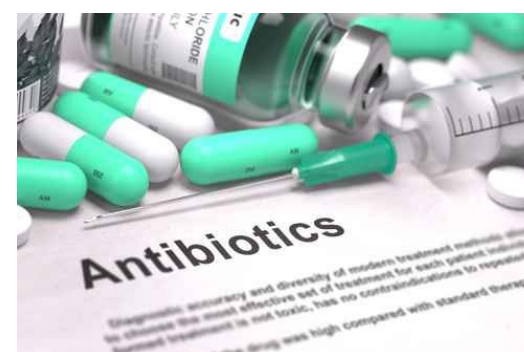
Slika 4. Antibiotici