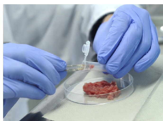
Slika 6. Analiza mesa