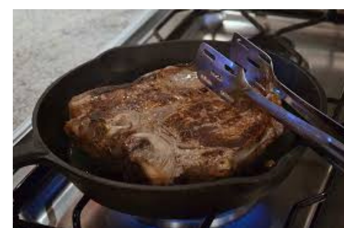
Slika 7. Prevenција potpunim pečenjem mesa