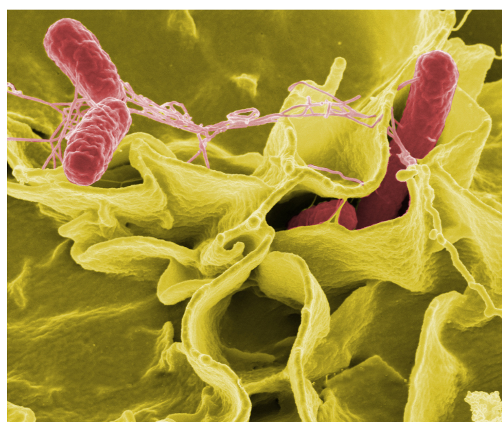
Slika 1. Salmonella bongori