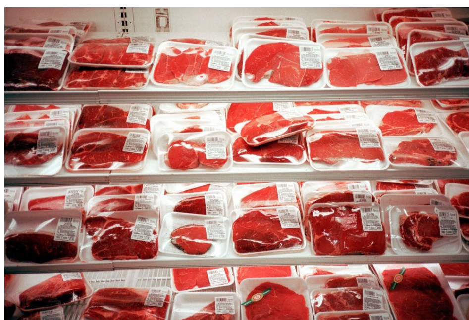
Slika 2. Meso zaraženo salmonelozom