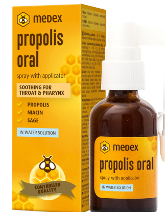
Slika 5. Propolis