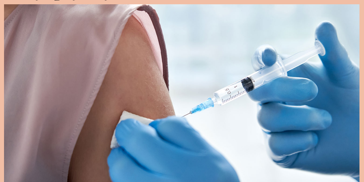
Slika 4. Cijepljenje