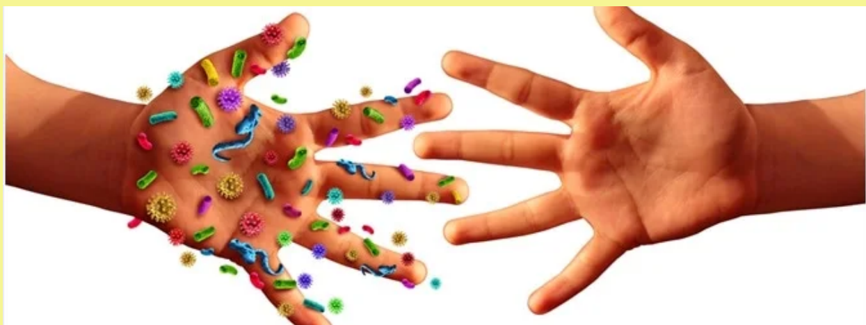
Slika 1. Prijenos zaraze