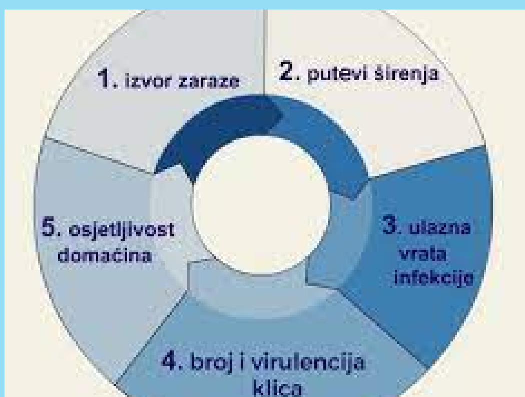
Slika 3. Vogralikov lanac