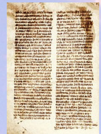
Zapis popa Martinca o bitki na Krbavskom polju